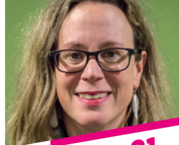
UTI JOHNE 21

52 Jahre / Diplom-Ingenieur / seit 1998 in München / Ich wünsche mir eine nachhaltige Energieversorgung und effiziente Mobilitätslösungen für den Münchner Osten.