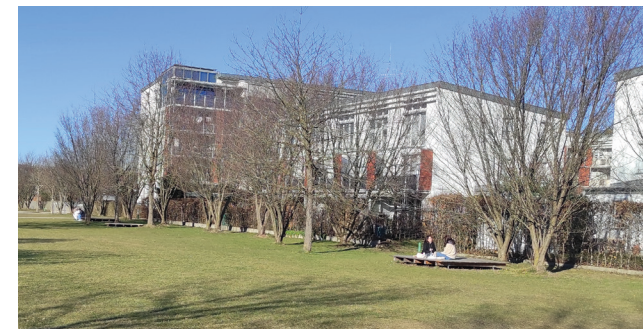
Holzterrassen unter den Kirschbäumen