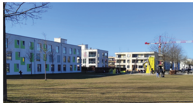
Spielplatz Kopenhagenstraße ohne Abgrenzung zur Häuserfassade