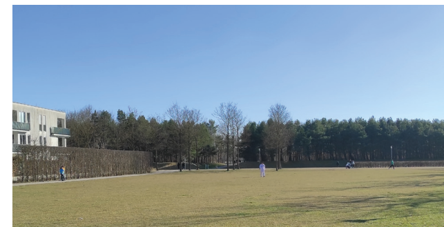
Grünfläche angrenzend zum Park -> (Bepflanzung in Fußballtorform?)