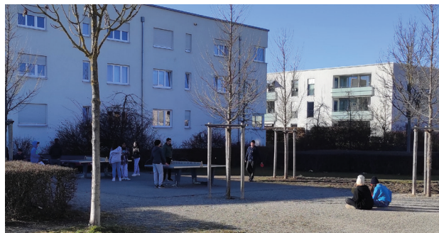
Tischtennisplatten im Schatten