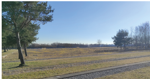
Blumenwiese mit Streifen als Andeutung auf die ehemalige Flugpiste