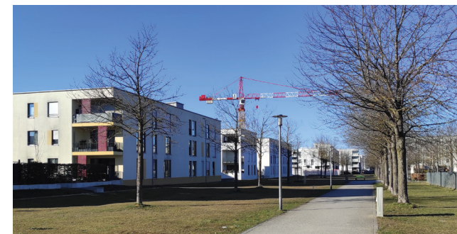
Ungenutzte Grünfläche nördlich der Kopenhagenstraße