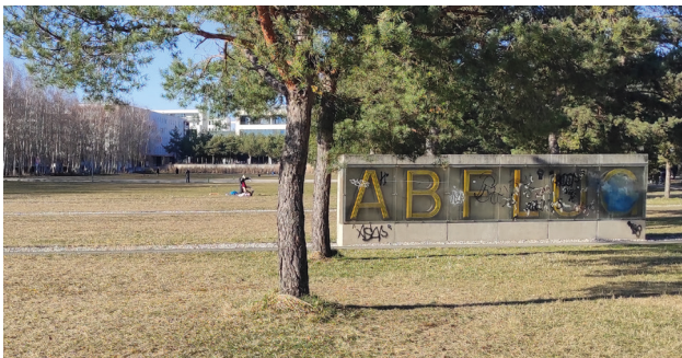
Grünfläche mit Abflug-Schild