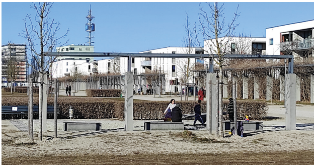
Spielplatz angrenzend zum Riemer Park